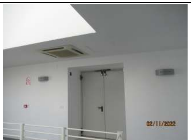
ETAJUL 3 – acces birouri