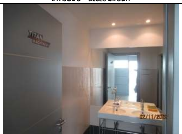
ETAJUL 3 - baie