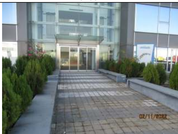
ACCES IMOBIL C1