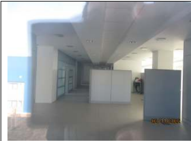
ETAJUL 2 - detaliu