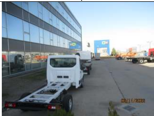
LOT 10 - parcare