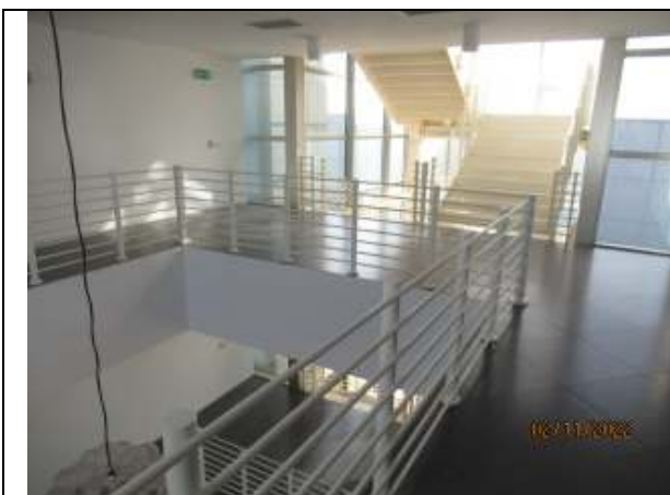
ETAJUL 2 - hol