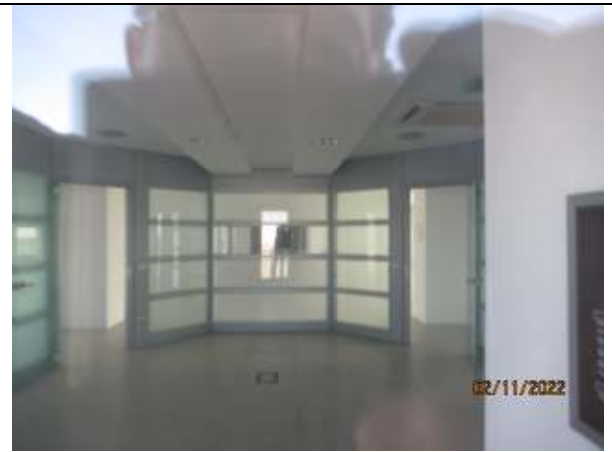
ETAJUL 3 - detaliu