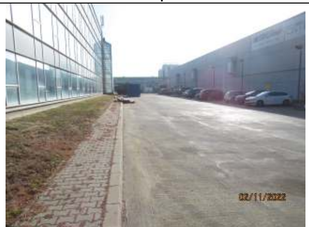
LOT 11 - parcare