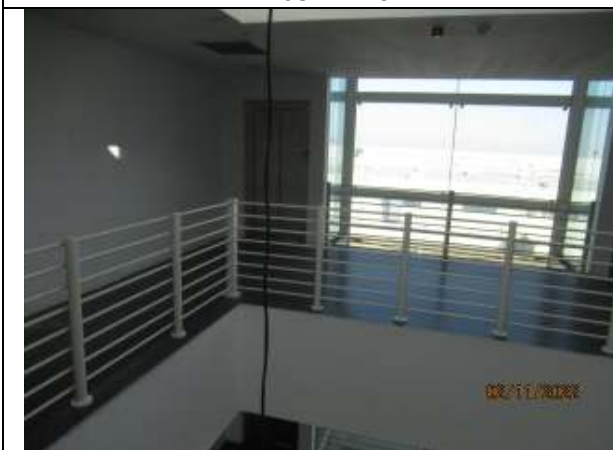
ETAJUL 3 - hol