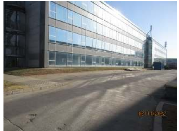
LOT 11 - parcare