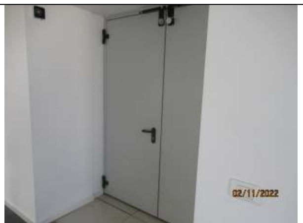
ETAJUL 2 – acces birouri