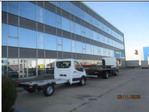
LOT 10 - parcare