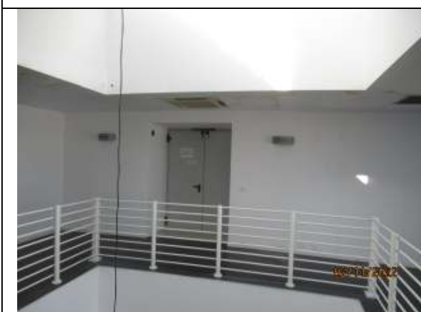
ETAJUL 3 - hol